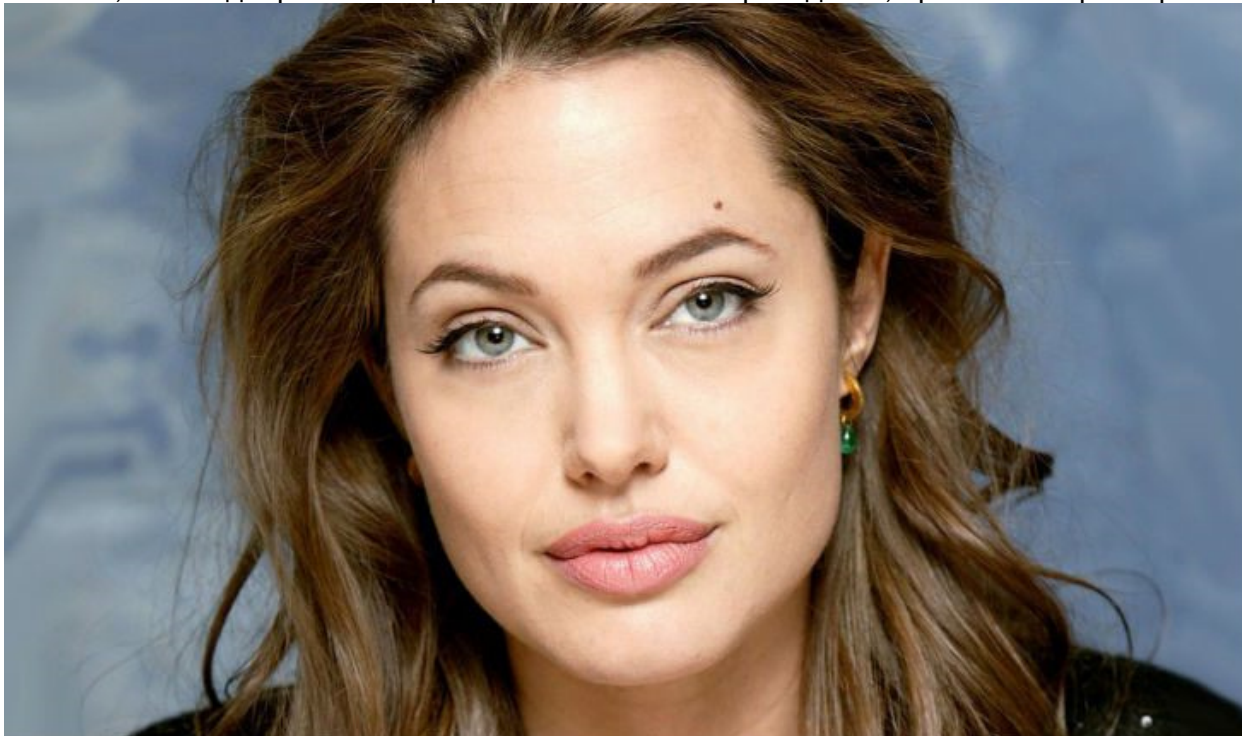
На фото: Анджелина Джоли

Анджелина Джоли – уникальное явление в современном мире, она не только талантливая актриса и режиссер с многомиллионными гонорарами, но и самая желанная женщина на планете, посол доброй воли при ООН и мать шестерых детей, трое из которых приемные.